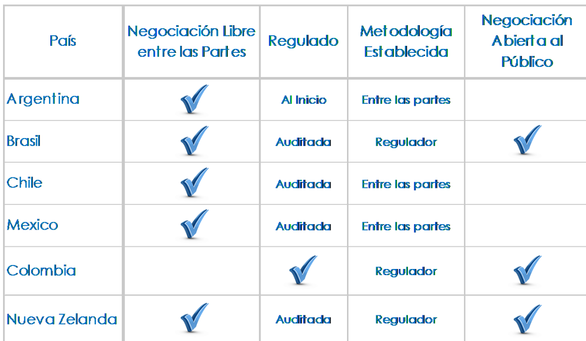
Tabla#1 Estado Roaming Nacional Internacionalmente

En el caso de Chile para la licitación de licencias 4G se estableció en los plieg