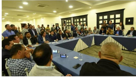
QUITO. Reunidos en Quito, los dirigentes del transporte de Ecuador anunciaron una paralización de todo el sector en protesta a la eliminación del subsidio a la gasolina extra y al diésel.