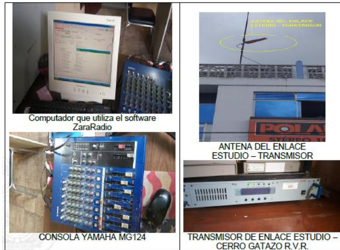
Imagen 2.- Equipos instalados en el estudio de radio POLANCO STEREO FM (101.9 MHz), en la ciudad de Esmeraldas