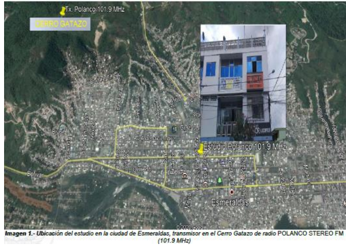
Imagen 1.- Ubicación del estudio en la ciudad de Esmeraldas, transmisor en el Cerro Gatazo de radio POLANCO STEREO FM (101.9 MHz)

En el estudio ubicado en la ciudad de Esmeraldas se encontró operando los siguientes equipos: