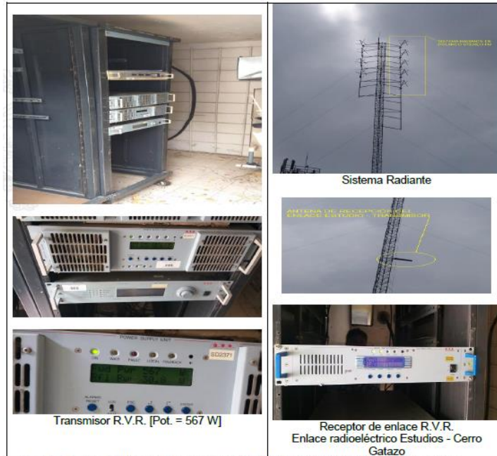
Imagen 4.- Equipos instalados en la caseta de radio POLANCO STEREO FM (101.9 MHz), en el Cerro Gatazo

Con el dato de potencia de transmisión verificada durante la inspección (567 W) y tomando en cuenta los datos de pérdidas en cables y conectores (1.5 dB) y ganancia máxima del sistema radiante (4.27 dBd), se obtuvo el siguiente valor de potencia efectiva radiada P.E.R.: