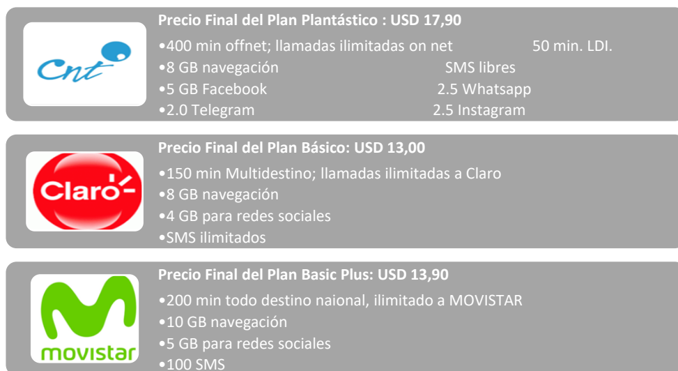
Esquema 1: Detalle de planes de internet móvil. Fuente: Páginas web operadoras. Elaboración: CRDM.

Para el Servicio de Acceso a Internet Móvil, se revisó las características de los planes comerciales más económicos, vigentes y promocionados en sus respectivas páginas web, obteniéndose lo siguiente: