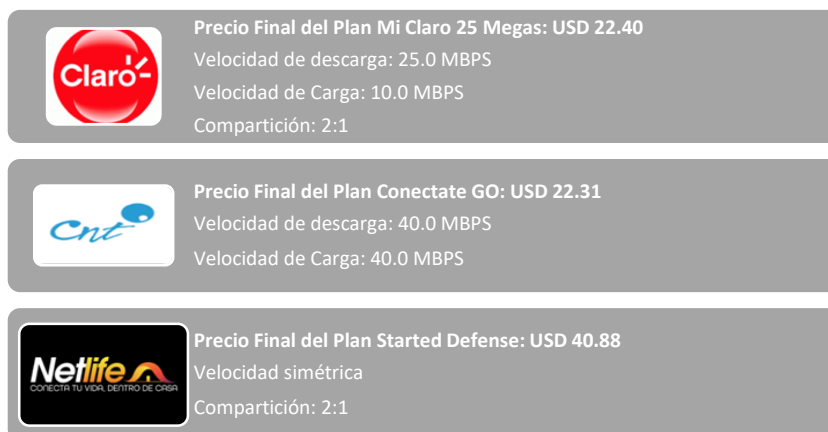
Esquema 2: Detalle de planes de internet fijo más económicos promocionados.

De lo mencionado, para el Servicio de Acceso a Internet fijo, se realizó una revisión de las características básicas de los planes comerciales más económicos vigentes, promocionados por cuatro prestadores en sus respectivas páginas web, obteniéndose lo siguiente: