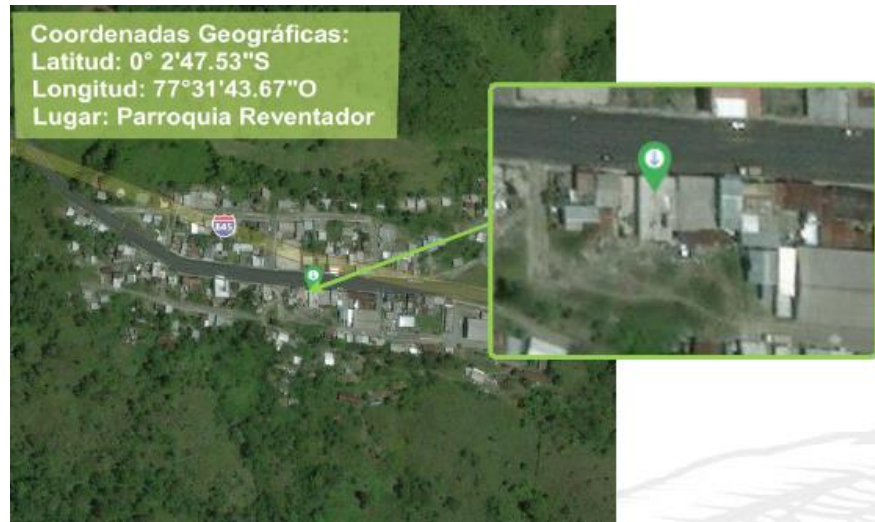
Imagen 5. Nodo “Reventador” ubicado en la vía a Quito de la parroquia Reventador del cantón Gonzalo