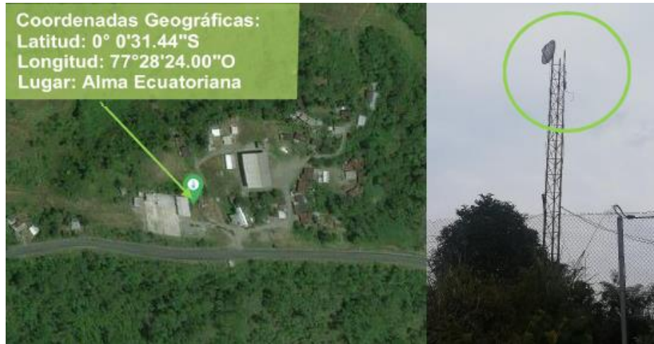
Imagen 9. Nudo "Reventador" ubicado en la vía a Quito de la parroquia Reventador del cantón Gonzalo Pizarro, provincia de Sucumbios.