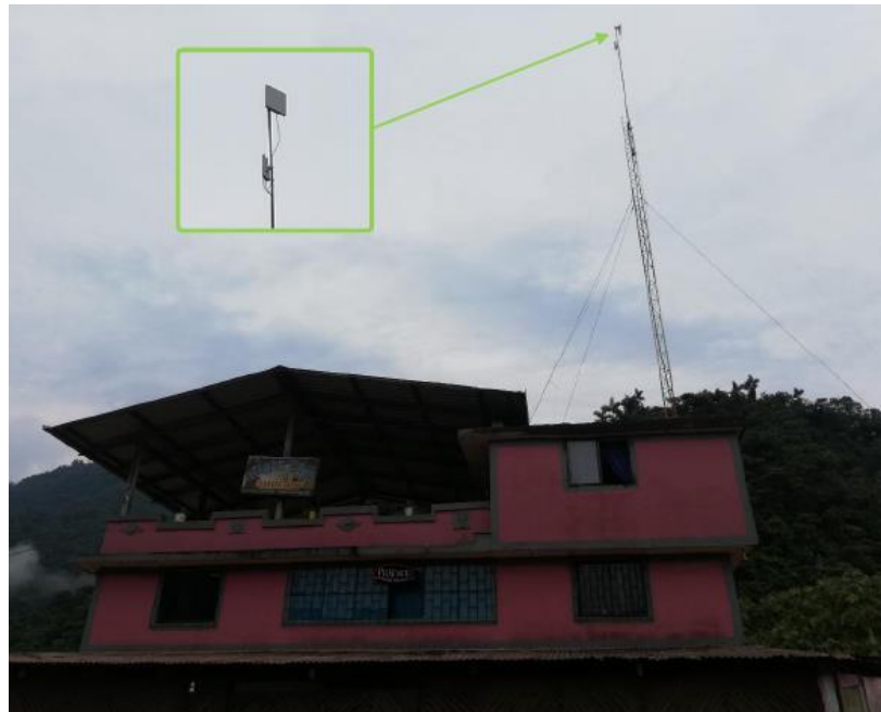
Imagen 2. Infraestructura de telecomunicaciones instalada en el Nodo "San Luis", en el establecimiento denominado "Night Club Imperio" en el recinto San Luis, en la vía a Quito, provincia de Napo.

En la inspección de control técnico efectuada el día miércoles 14 de agosto de 2019, se verificó que en el inmueble ubicado la vía a Quito en el sector de San Luis de la provincia de Napo (Coordenadas geográficas: Latitud: 0° 0' 7'55.79"S – Longitud: 77°36'38.30"O), se encuentra instalada una torre soportada y antenas para acceso de abonados del Servicio de Acceso a Internet, conforme se puede visualizar en la Imagen No. 2.