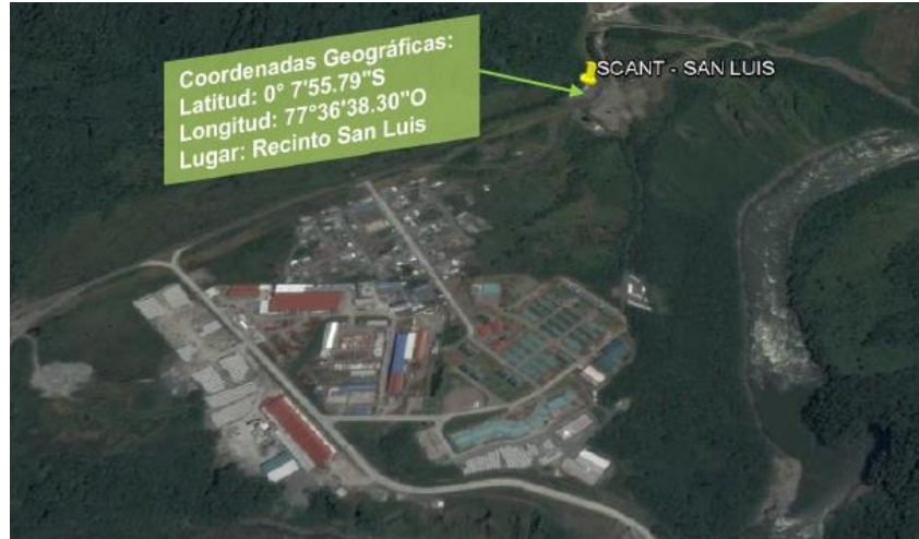
Imagen 1. Nodo "San Luis" ubicado en el recinto San Luis, en la vía a Quito (Troncal Amazónica), provincia de Napo.