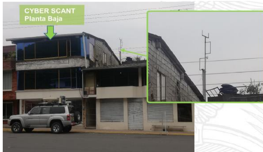
Imagen 6. Infraestructura de telecomunicaciones instalada en el Nodo “Reventador” ubicado en la vía a Quito de la parroquia Reventador del cantón Gonzalo Pizarro, provincia de Sucumbíos.

En la inspección de control técnico efectuada el día miércoles 14 de agosto de 2019, se verificó que en la terraza de un bien inmueble (Imagen No. 6) ubicado en el sector de la vía a Quito s/n de la parroquia Reventador (Coordenadas Geográficas: Latitud: 0° 2'47.53" S - Longitud: 77°31'43.67" O), del cantón Gonzalo Pizarro, provincia de Sucumbíos, se encuentra instalada una infraestructura de telecomunicaciones con antenas, con la cual se provee del Servicio de Acceso a Internet a usuarios de la parroquia El Reventador y sitios aledaños.