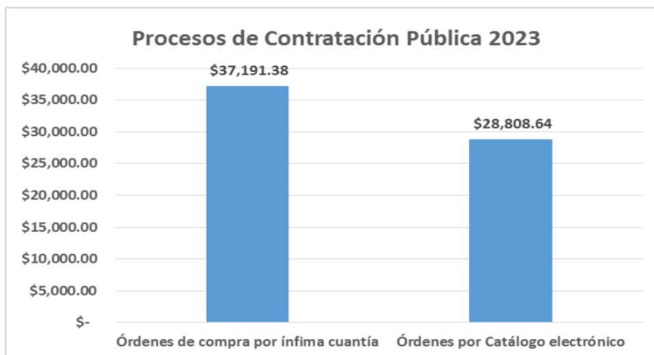
Gráfico 3. Contratación Pública

Elaborado por: Mgs. Mariana Barros V