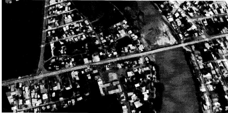
Fig. 1 Área de búsqueda de señales interferentes

de espectros y una antena direccional, se ubica el azimut de las señales (con mayor intensidad de campo), con el objetivo de detectar sus orígenes, logrando encontrar la siguiente novedad: